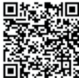
Através do QR Code acima, ouça o novo disco de Baco Exu do Blues

As “lives” ainda não conseguem monetizar o suficiente para o setor fazer disso um ganha-pão viável. Mas a ideia de criar conteúdo novo - a um público ávido por novidade - e distribuí-lo através de plataformas como Spotify ou Deezer, ainda rendem ao compositor alguns trocados através dos royalties pagos por esse serviço. Melhor que nada!