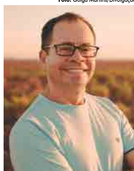
Prostíbulo perto do sítio onde passou a infância foi inspiração da peça do realizador paraibano

O paraibano recordou da velha estrada carroçal que cruzava com duas outras formando um triângulo,