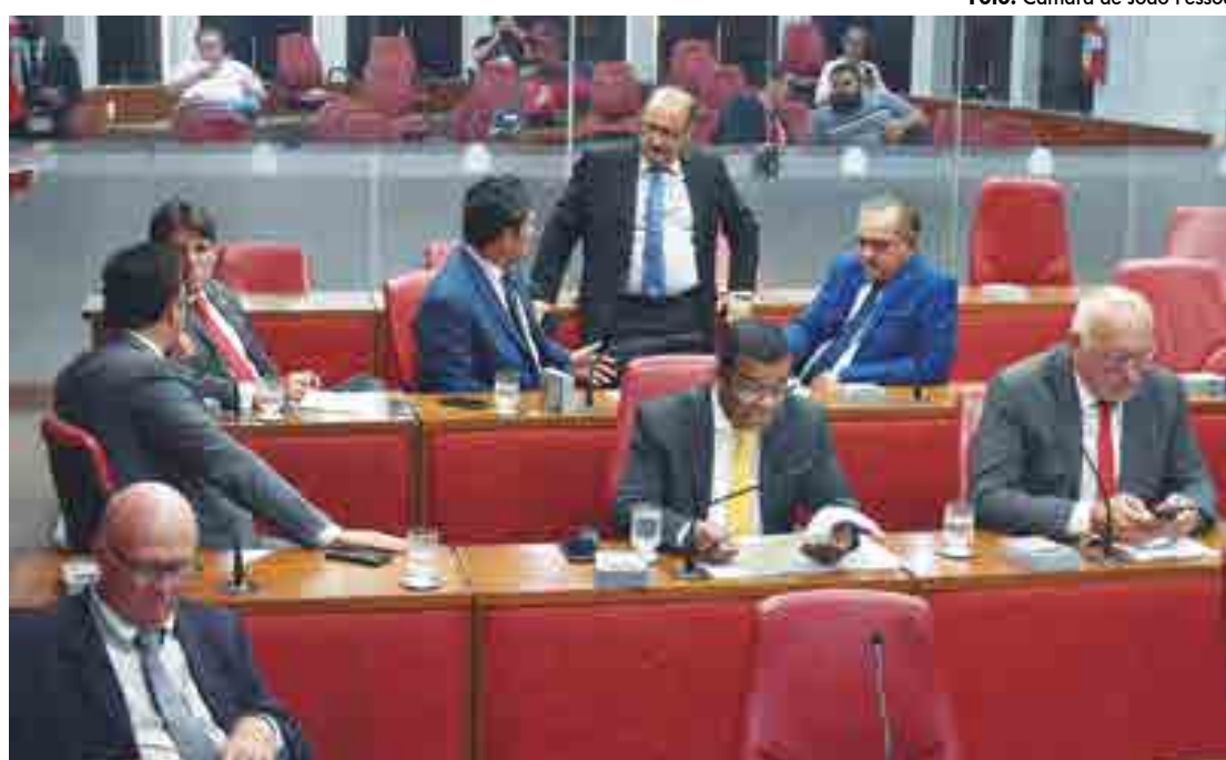
Depois das negociações, algumas siglas terminaram formando “chapões” para a disputa no pleito de outubro