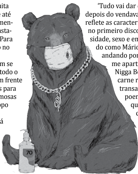
Ilustração da capa do novo disco do Baco Exu do Blues

‘Preso em casa cheio de tesão’ reflete o distanciamento em letra repleta de sacanagem. Em ‘O sol mais quente’, ele encontra brecha para refletir e fazer valer o discurso social que lhe fez fama: “Coronavírus me lembra escravidão / brancos de fora vindo e f***ndo com tudo”. ‘Tropa do Babu’ é um desabafo sobre o racismo que o ator Babu Santana tem recebido no Big Brother Brasil , dentro e fora da tela.