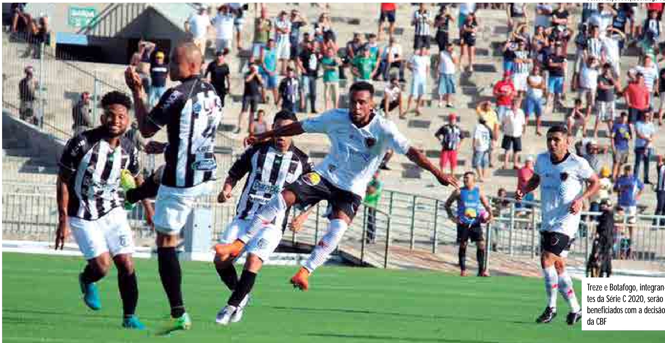
Treze e Botafogo, integrantes da Série C 2020, serão beneficiados com a decisão da CBF