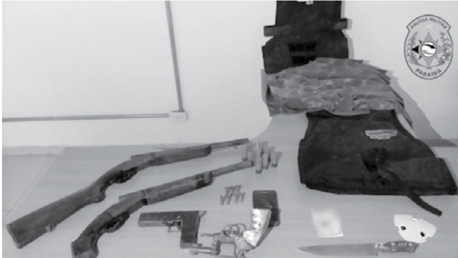
Armas, coletes, munições e outros materiais foram apreendidos em ações da Polícia Militar na cidade de Bayeux e no bairro de Mangabeira, em João Pessoa, onde também foram presos dois homens