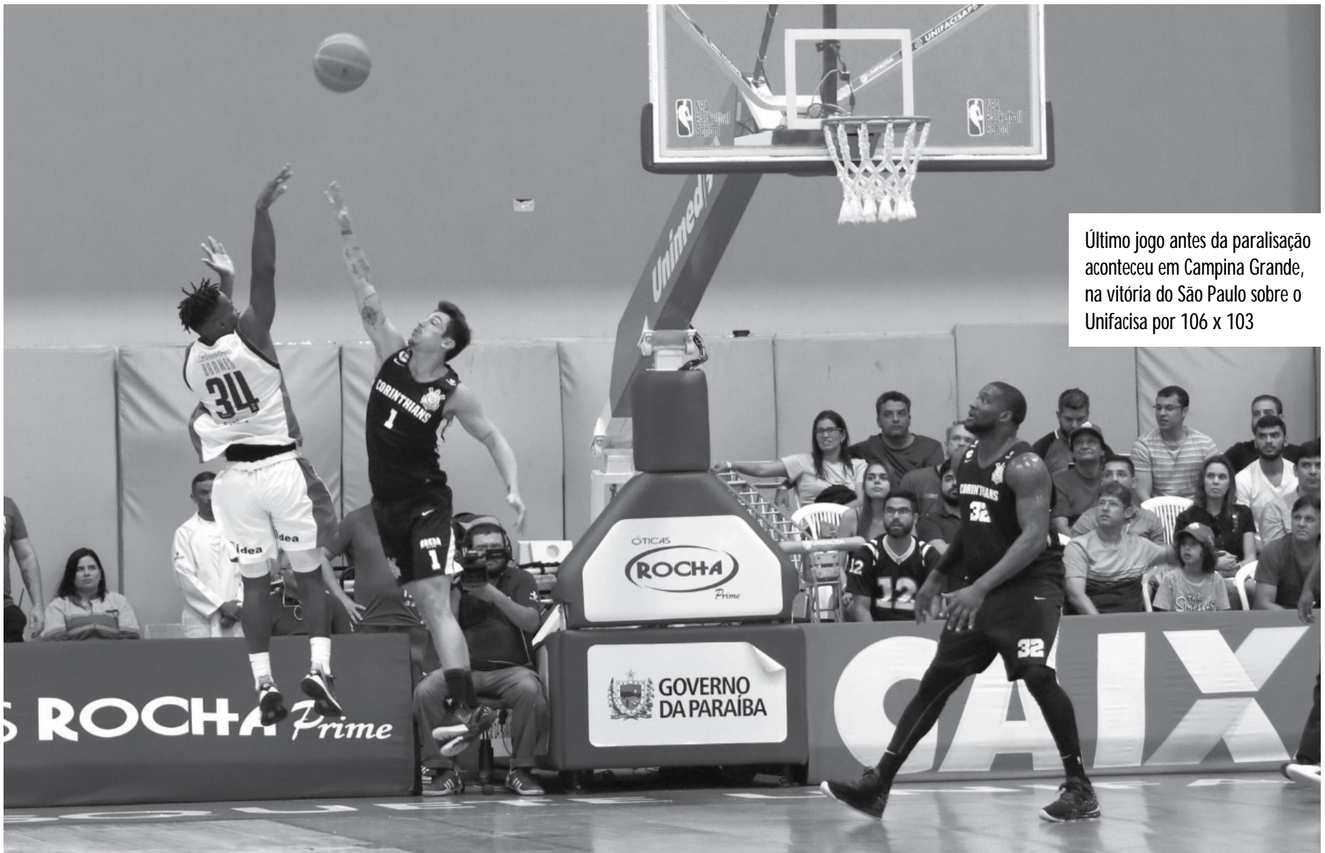
Último jogo antes da paralisação aconteceu em Campina Grande, na vitória do São Paulo sobre o Unifacisa por 106 x 103

As outras duas definições da reunião entre os clubes foi a redução de 20% do salário base do corpo executivo da Liga Nacional de Basquete ao longo dos próximos cinco meses. A medida não atinge funcionários com rendimento de até um salário mínimo e faz