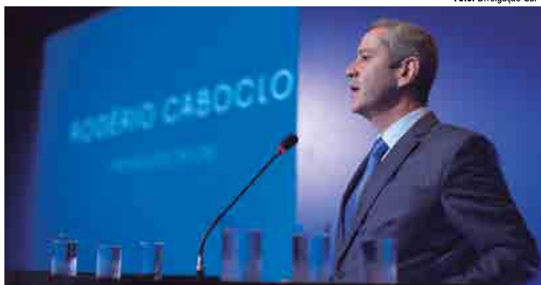
O presidente da CBF, Rogério Caboclo, anunciou as medidas de ajuda financeira para equipes e federações

Já para os aos árbitros do quadro nacional, a entidade decidiu fazer o adiantamento do pagamento de uma taxa de arbitragem, calculada a partir da maior taxa paga pela CBF em 2019 para sua categoria, no valor total de R$ 900 mil.